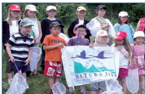
Les enfants du Centre de loisirs

Mercredi 21 juillet 2010, des enfants du centre de loisirs de Lannoy Cuillère-Criquières ont pu participer à une animation nature sur un larris calcicole du site Natura 2000 "Vallée de la Bresle". Propriété de la commune de Lannoy-Cuillère dont la gestion a été confiée au Conservatoire des espaces naturels de Picardie depuis quelques années, ce site fait l'objet d'une gestion pastorale extensive par les ovins, ce qui permet de