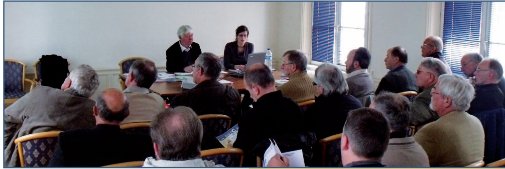
A Gamaches, le 11 mai 2010

L'étude menée actuellement par la commune de Longroy conforte le fait que cette problématique relève d'une étude hydraulique de bassin versant. Celle-ci concernerait 1 042 ha répartis sur 4 communes de Seine-Maritime. Les membres du Conseil d'administration de l'Institution Bresle, réunis le 18 octobre 2010, se sont prononcés en faveur de la maîtrise d'ouvrage de cette étude par l'Institution,