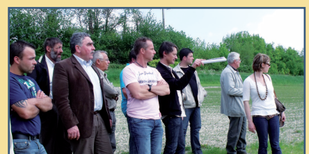
Visite de la plateforme des techniques alternatives du CFPFA d'Airion

Merci à la Communauté de communes du Plateau Picard pour son accueil !