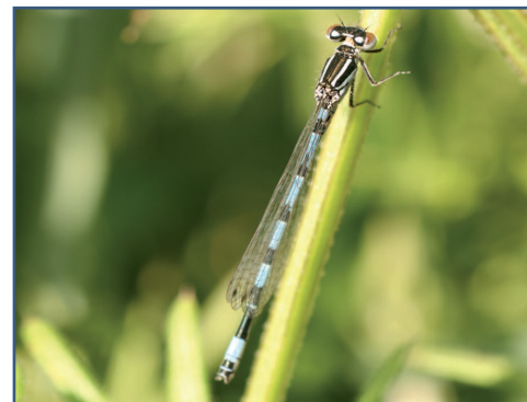
L'Agrion de Mercure, une des espèces emblématiques à préserver sur la vallée

Pour connaître les modalités d'aides à la mise en place de ces actions, contactez-nous et demandez la plaquette ou alors rendez-vous sur www.eptb-bresle.com