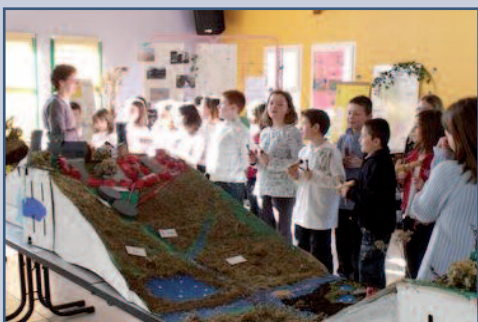
Les enfants de l'école de Saint-Rémy-Boscrocourt lors de l'exposition de leurs travaux

Véritable éducation à la citoyenneté et à l'environnement, la classe d'eau a pour finalité d'impliquer la population, à la fois dans ses gestes quotidiens et dans sa participation à la vie locale auprès des acteurs de l'eau.