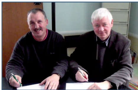
Signature de la convention de partenariat entre l'EPTB Bresle et le Syndicat de la Vimeuse dans le cadre de l'étude hydraulique de la Vimeuse aval

Le Syndicat intercommunal d'aménagement hydraulique du bassin versant de la Vimeuse (SIAHBVV) a pour projet d'engager prochainement une étude hydraulique sur l'aval du bassin versant, complémentaire à celle déjà réalisée sur l'amont en 2002. L'EPTB de la Bresle, ayant par nature un rôle de coordination et d'accompagnement des acteurs locaux en matière de gestion du bassin versant, apportera un soutien technico-administratif au syndicat pour le pilotage de cette étude.