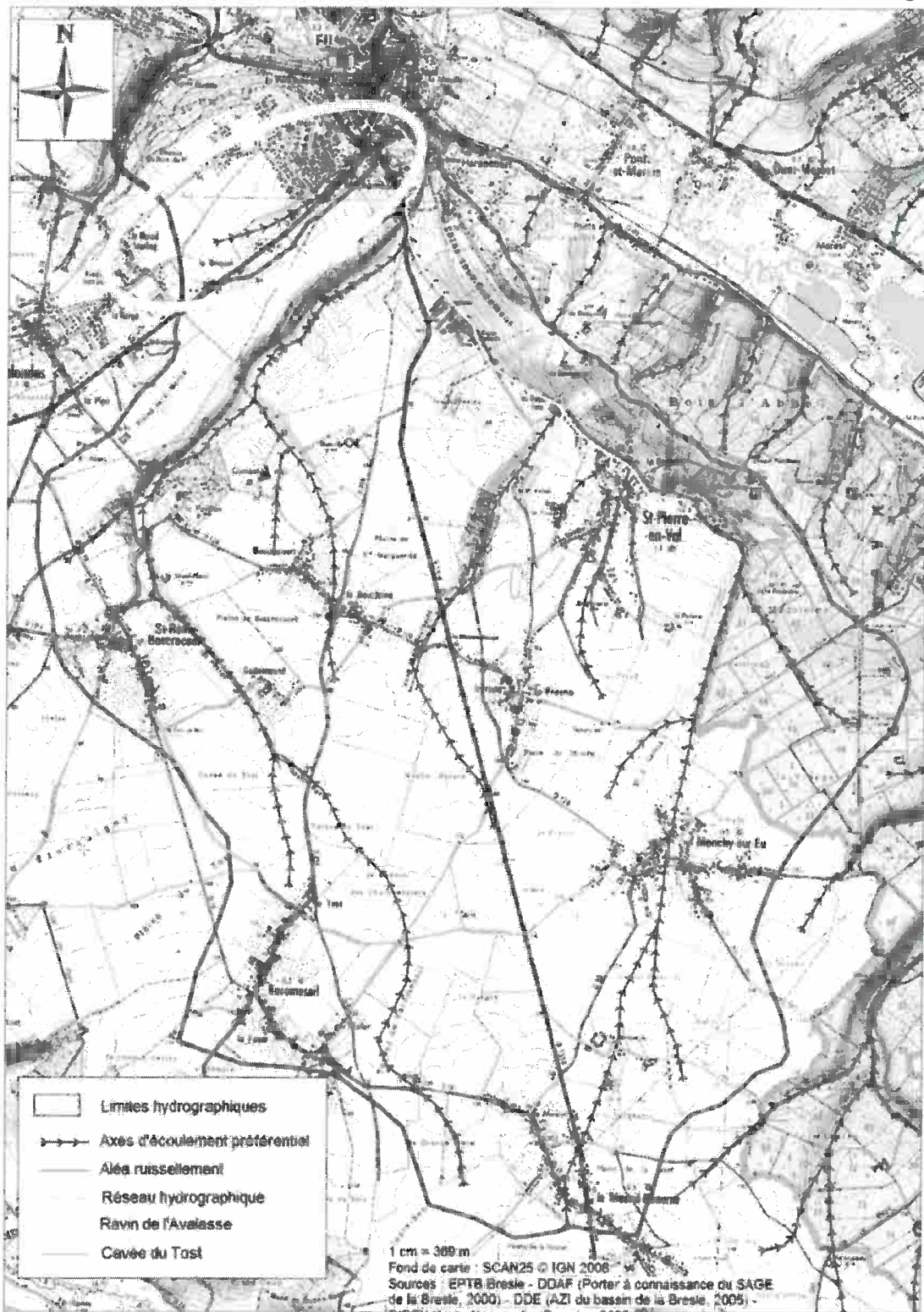
Localisation du sous bassin versant « Le Briquet » (cercle jaune)